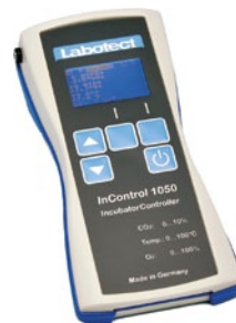
InControl 1050 Labotect GmbH