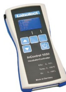
InControl 1050 Labotect GmbH